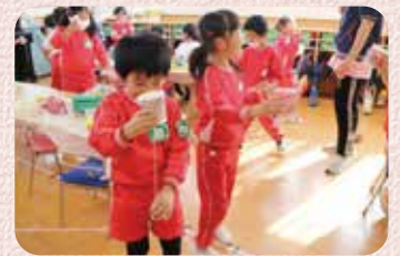
年長組SDGs製作活動「けん玉製作」

公開保育の経験がない職員が多く、保育を見直す良い機会をいただき、感謝申し上げます。