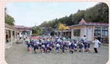
みんなで楽しく元気に体操

園バスから戻り、保育室に入るとたくさんの先生方がいらっやっていて、その雰囲気にも圧倒されながらも課題に対して、取り組みました。この公開保育で私は見られる側として、新任ということもあり、普段どおりの保育を行うことがすごく難しいことなのだと思ふことができました。そして、いつでも自信を持って保育を実現したいという新たな目標を見つけることができました。今後、他園を見る機会があれば、子どもへの声かけや興味を惹きつける工夫について学びたいと思っています。