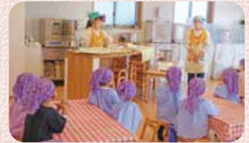
パン作りがんばるぞ～(年中組)

予定より2年遅れの公開保育は「楽しい時間の共有」を研究主題に、クッキングや英語教室、サーキットやICT活動などの当園らしい保育をご覧いただきました。お客様が大好きな子どもたちは、そのなかでも普段通りに元気いっぱい活動に取り組み「今日一日を皆で楽しむ」生き生きとした様子を楽しんでいただけたと思います。公開保育を経験することで職員一人ひとりの成長も感じることができました。また、ご参加いただきました先生方からはたくさんの励みになるお言葉を頂戴しましたので、これからも子どもたちの生きる力に重きをおきながら、日々保育に邁進してまいります。