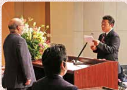
永年勤続者代表謝辞