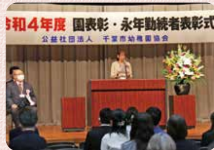
保育者の体験発表