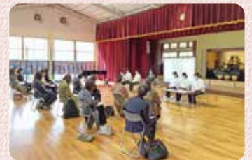
保育内容とそのねらいを説明する担任

11月9日は爽やかな秋晴れのなかでの公開保育となりました。当園の一日は朝、園庭で体を動かすことから始まります。体をほぐし、リズムに合わせて走ったり体操したりして徐々に頭と体を目覚めさせていきます。その後、心を整え仏さまにご挨拶、全員そろって歌を捧げます。教室に戻り乾布摩擦をするところまでが朝のルーティンとなっており、参観いただきました。また、翌週に発表会を控えていたことから、ホールでの歌の練習もご覧いただきました。ご参加いただいた先生方からは貴重なご意見をいただきました。日頃の保育を振り返るよい機会となりましたこと、心より感謝申し上げます。