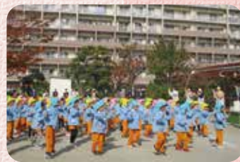
戶外遊びの最後に全園児で体操しました

青空の下、園庭で全園児が元気いっぱい、笑顔いっぱいの姿をお見せすることができ、とても嬉しく思いました。公開保育では前半に全園児の戶外遊び、8カ所のコーナーを選びながら楽しく遊び、後半は各クラスで主活動を行いました。ご参観いただいた先生方からは「全園児が一斉に外遊びを楽しめる素敵な時間でした」「落ち着いて話を聞く姿に感心した」など、温かく貴重なご意見をいただきました。ありがとうございました。