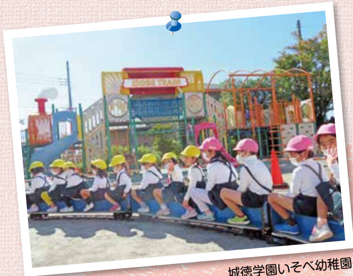
城徳学園いそべ幼稚園