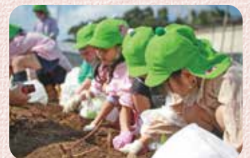
土の感触を感じ、友だちと楽しみながらさつま芋を収穫している所

分科会では「生きる力」について貴重な意見を伺う時間もできました。ありがとうございました。