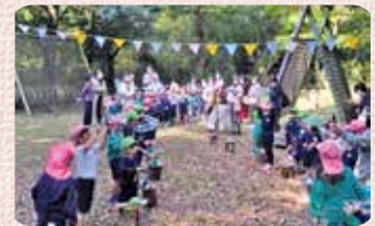
年長・年中・年少 合同の音遊び 自分で作った各楽器を使って

今回の公開保育で貴重なご意見やご感想をいただきました。今後の保育活動に活かし子どもたちと真摯に向き合い、日々の保育活動を深めてまいります。