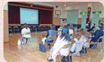
保育を振り返って

参加された先生方からも貴重なご意見を伺えましたので、今後の保育に活かし、子どもとともに日々楽しく成長できる幼稚園でありたいと思いました。