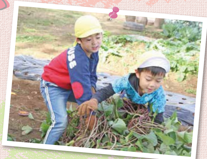
由田学園千葉幼稚園