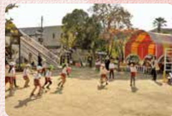
園庭でドッジボール

日頃の保育を継続し、子どもたちが日々生き生きとした笑顔で、意欲的に活動できるように共にすすめていきたいと思います。