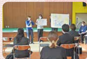
全体会で各学年の保育を共有しました

本園は「ECEQを活用した公開保育」を行いました。コロナ禍にもかかわらず、開催の主旨を理解されて、ご来賓の方を含めて16名の方々が参加されました。園が設定した「問い」に丁寧にお答えいただき、また午後の話し合いでは参加された先生方の園の様子も細かに示されて、実りのある時間となりました。私たちが目指した「保育について話し合う」ことが、参加者の皆さんと共有できていたら大変嬉しく思います。