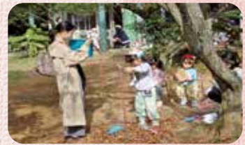
子どもたちとの交流もあちこちで！

今回公開園という機会をいただき、今までの保育を振り返り、子どもたちのなかに育てたいことや大切にしたいことなどを教師間でも再確認することができました。心を新たに歩み出した今年度、子どもたちの本当にやりたいことを大切にしてきました。当日も普段の自主活動(子どもたちが遊びや場所を選び、やりたい遊びを行う、自主的に活動できる時間)を先生方に見ていただき、心温まるご意見に励まされました。今後も目の前の子どもたちをよく観察し、必要な手を差し伸べられる私たちでありたいと思っています。