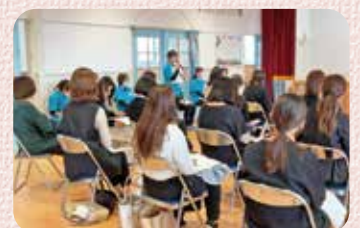
ホールでの全体会

今後も子どもの「やってみたい」の兆しを見逃さず「できる」自信から「大好き」自己肯定感へと導けるような支援をしていきたいと思ひます。