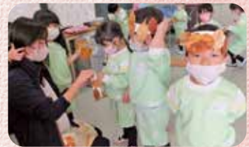
園庭で拾って集めた葉での冠づくり

ご来賓や参観者の方から貴重な多くの助言をいただき、職員一同今後も保育の充実に向けて大きな励みとなりましたこと、心より感謝申し上げます。