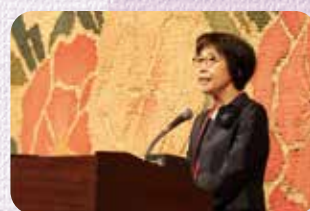
保育者の体験発表