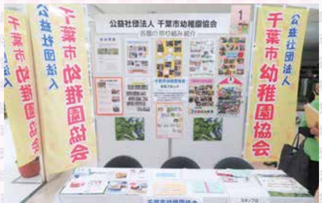
千葉市幼稚園協会のブース