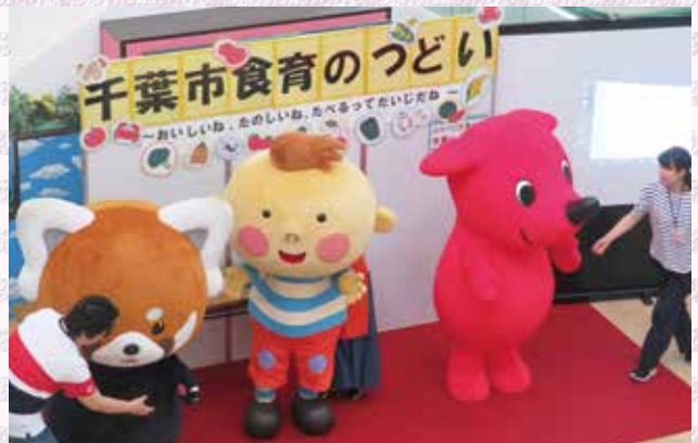
チーバくんたちとともに