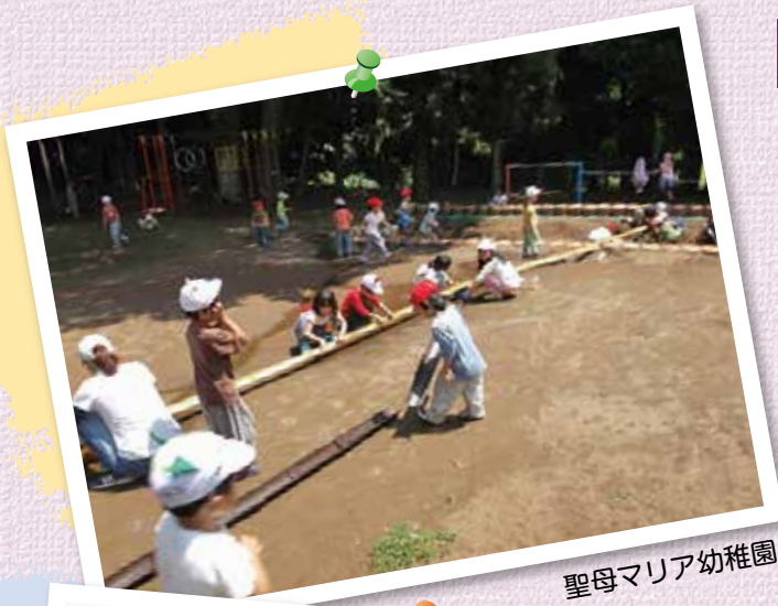
聖母マリア幼稚園