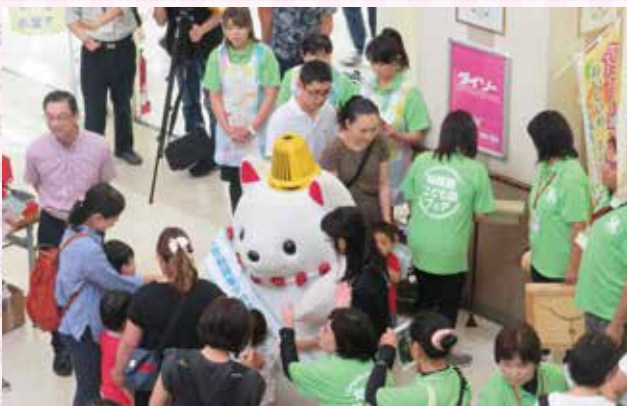
かそりーぬも遊びに来てくれました