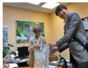
日本からのお土産を渡す

最後に園長先生が教育で大切にしていることは「子どもたちが幸せであること、そして最高レベルの力を引出すこと、言語教育として英語とフランス語をできるだけ身につけることです」とおっしゃっていたのが印象的でした。