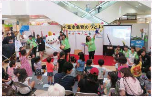
会場のおともだちと体操！