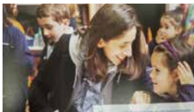
子どもたちの様子

2人に合格しなくてはなりません。フランス語か英語が話せれば、両親のうちのどちらかが外国人でなくても構いません。3年間かけてフランス語の読み書きができるように教育していきますが、フランス語を3/4とすると、英語教育には1/4程度(3歳から1日30分)を費やします。フランス語以外にも英語、スペイン語、ドイツ語、中国語の選択もできます。環境も凱旋門の近くで目の前に大きな公園があり、ピクニックやお遊戯にも最適です。3歳までは集団生活のシステムに慣れさせることが第一と考えられ、お昼寝の時間もありますが、徐々に読み書き計算、お遊戯、絵筆を持たせるなど、幼稚園に行くことが好きになり、ひいては勉強するのも好きになるような教育がなされています。