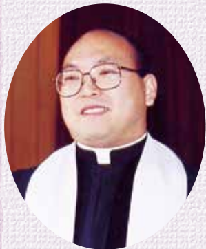
千葉市幼稚園協会会長 (羔幼稚園理事長・園長)