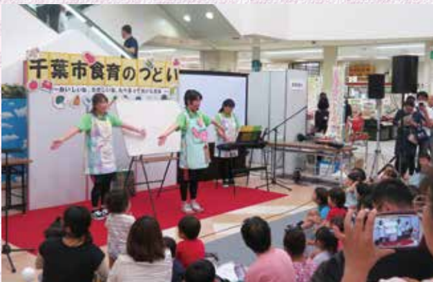
パネルシアターを通して食育の大切さを感じました